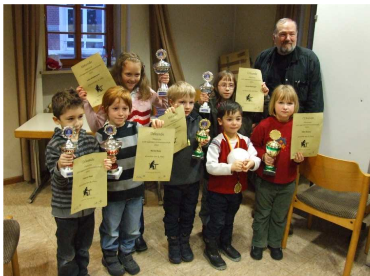
Die Sieger der U10 Meisterschaft (v.l.n.r.):